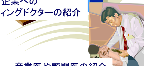
産業医や顧問医の紹介