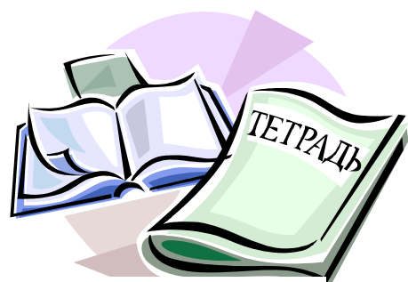
雑誌・書籍・会報誌 向けコンテンツの制作・監修