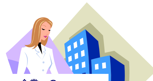
企業への コンサルティングドクターの紹介