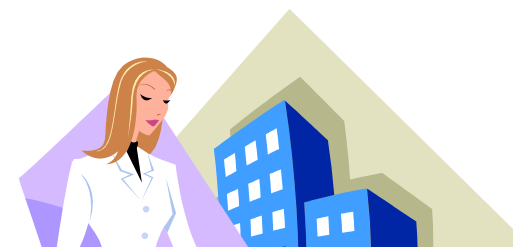
企業への コンサルティングドクターの紹介