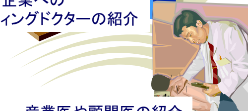
産業医や顧問医の紹介