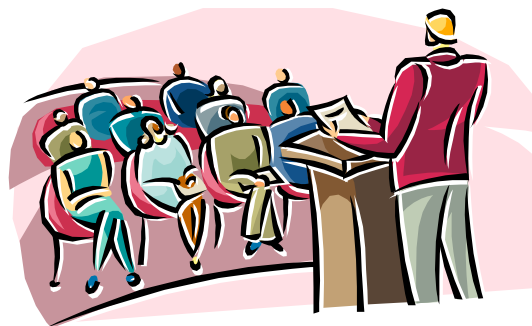
セミナー講師の紹介