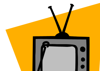
テレビ・ラジオ向けコンテンツ制作支援・監修