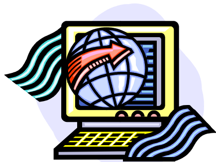
医療系WEBサイトやコンテンツの制作・監修