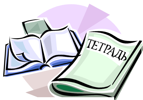
雑誌・書籍・会報誌 向けコンテンツの制作・監修